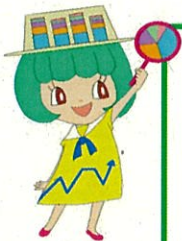
兵庫県統計協会マスコット グラちゃん