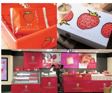
▲商品パッケージをはじめ、店舗&ブースデザインなど、トータルコーディネートで提案制作する。