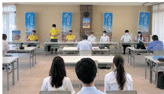
▲プレスリリース発表会において、商品をPRする同市商工会青年部員と甲南大学・西村ゼミの学生。

淡路市商工会青年部では、今後も地域の課題を解決し、地域経済の発展へと繋がる事業を展開したいとしている。