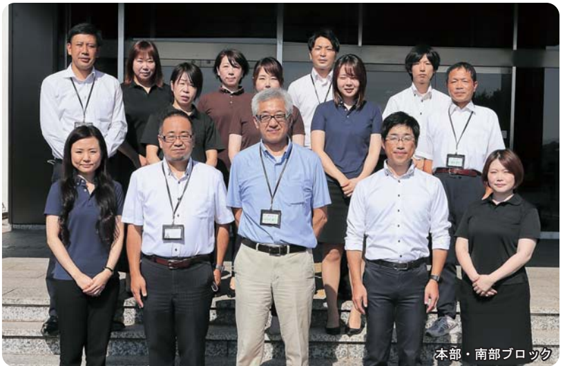
本部・南部ブロック