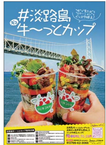
▲同商品PRのポスター

なお、同商品は、全国商工会連合会の「ビジネスコミュニティ型補助金」第1回申請において採択を受け、発売に向けて、カップにはオリジナルデザインのパッケージを採用し、チラシ、ポスター、のぼり等を製作し広報面を強化した。また、持ち運びしやすいカップにしたことで、島の観光スポットと一緒に撮影した写真をSNSで若い世代