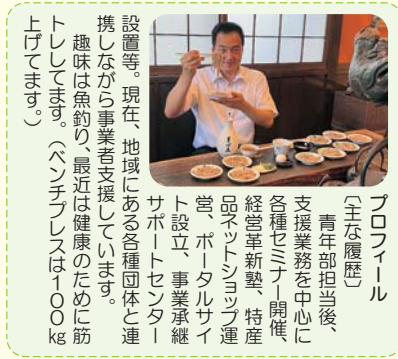
プロフィール 〔主な履歴〕 青年部担当後、支援業務を中心に各種セミナー開催、経営革新塾、特産品ネットショップ運営、ポータルサイト設立、事業継続サポートセンター設置等。現在、地域にある各種団体と連携しながら事業者支援しています。趣味は釣り、最近健康のために筋トレしています。(ハンチングは100kg上げてます。)

効率の良い方法(支援スケジュール作成)を考え、そして提案(成功事例の提示)し取り組みます。この流れが伴走型支援になります。補助金申請には事業計画が必須ですが、事業計画作りに関しては認定支援機関の中で商工会が一番の支援力があります。また、採択実績のある商工会職員は、必ず計画見本を用意しています。過去の事例を参考的に確かなアドバイスが期待できると思います。中でもチーフコーディネーターは知識と経験を活かし、事業者の強みを持ち上げるパワーがあるので相談してください。 環境に左右されやすい状況ですが、会員事業所に寄り添い継続発展ができ、事業展開の役に立てるよう取り組んでいきたいと思えます。