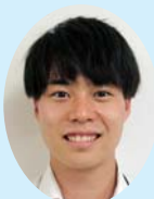
おおたけ 大椿 小ひばり 響

私は以前市川町商工会で臨時職員として4カ月間勤務しておりました。体育系大学の出身ですので、明るく、元気よく毎日勤めて参ります。まだまだ分からないことばかりですが、少しでも早く皆様に覚えてもらえるよう、自分にできることは精一杯頑張りますのでよろしくお願い致します。