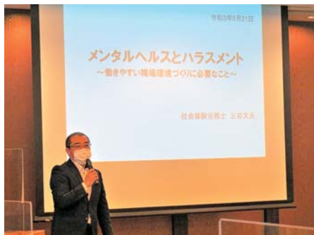
▲講演をする三谷氏

事務局連絡会議では、関係団体からコロナ禍における各種支援施策等について説明があり、県連合会は各種事業について報告や情報提供し、意見交換を行った。