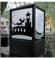
◀◀デザイン温地看 が城崎町 本掛した のインパ 橋を業で 泉事設置 事業等 業で

なお、この支援により、取引先から改めてテイクアウトチラシを受注することとなり、自社の売上回復にも貢献した。