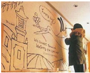
▲手描きのデザイン力を活かした店舗壁面の装飾。幼稚園教諭時代の経験も活かしているという。

毎日、育児と仕事を両立させながら事業を切り盛りする中、平成14年には従業員の雇用を機に実家がある豊岡市に事業所を移し法人化した。