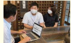
〔支援先情報〕 出石皿そば店 (有)そば庄 豊岡市出石町鉄砲27-13 TEL.0796-52-5639 URL: http://sobasho.com/

現在、担当している豊岡市出石地域では「出石そば」が特産で観光客が多く訪れます。それぞれ特徴ある出石そば店が約40軒並び、お昼時には行列ができるお店も沢山あります。その中の1軒、「(有)そば庄」を支援しました。新型コロナウイルス感染症の影響により観光客が激減している状況の中、①個別相談、②計画書策定、③専門家派遣による助言、④金融機関との連携と、相談支援をし、今年度創設された第1次「事業再構築補助金」に申請、6月に採択を受けました。新たな事業展開はこれからはありますが、今後も継続してフォローをしていきます。ひとつの支援実績が複数の事業所に波及し、より多くの事業者が活用し、新規加入促進、会員増強(組織強化)に繋がることから、複合的支援を意識することが大切だと考えています。 従前は、事前に準備し計画策定に時間をかけることを推奨していましたが、コロナ環境等変化の激しい現状では、身近な存在である商工会職員が初期相談をすることが一番の近道かと思えます。