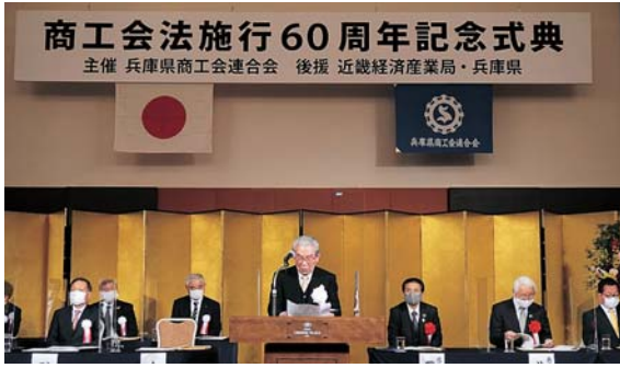
▲式辞を述べる志智会長

志智会長が式辞を述べ、60年の歴史と歴代会長の功績を称えるところにも、商工会の役割を再認識する場となった。