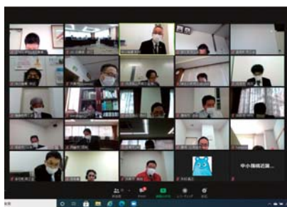
▲意見交換や各地域の情報交換を行う CCメンバー

研修では、独立行政法人中小企業基盤整備機構の講師から、連携事業継続力強化計画について学んだ。研修後の意見交換会では、各地域の状況や新たな施策について活発な意見交換が行われた。