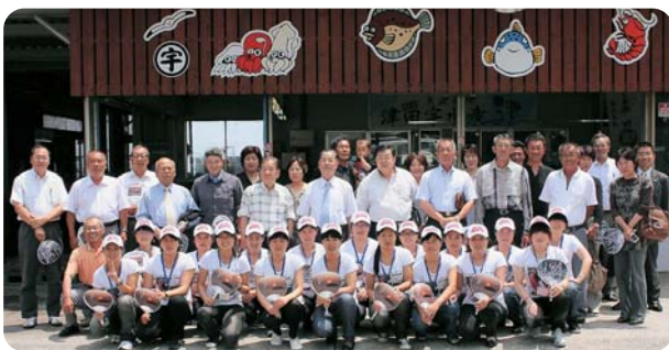
▲外国人技能実習生受入事業 歓迎会後の集合写真

今年度も新型コロナウイルス感染症の終息が見込めない中、会員事業所に寄り添った支援で地域経済を牽引することを第一の目標に掲げて臨機応変に事業を展開してまいります。