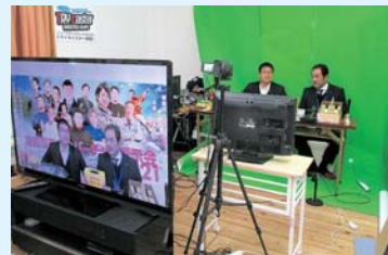
▲PR動画を撮影する様子

同商工会では初めての試みであり試行錯誤の部分も多かったが、ウィズコロナ、そしてアフター