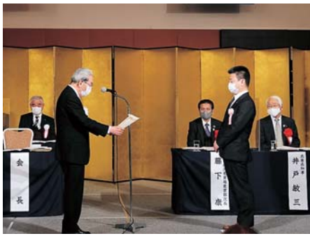
▲志智会長から表彰を受ける受賞者