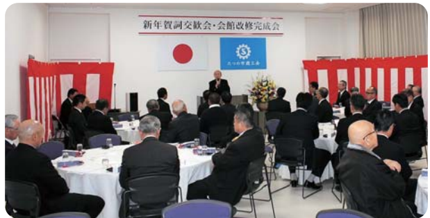
▲平成30年度 新年賀詞交歓会・会館改修完成会

たつの市商工会は、平成19年4月1日、新宮町、揖保川町、御津町の3商工会が合併して誕生しました。たつの市は商工会議所との併存地域であるため、合併当初より地域振興事業に力を入れてきました。地域の活性化を目的とするイベントや事業には積極的に参加するとともに、会員事業所や市内の事業者や団体と協力して特産品開発にも取り組みました。また、地域産業の育成として牡蠣養殖業を支援するため外国人実習生受入事業にも取り組んだ結果、多数の会員増加にも繋がりました。