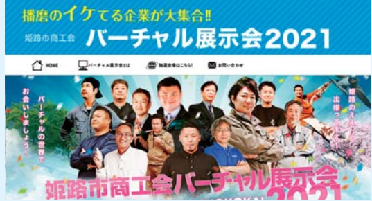
▲バーチャル展示会会場のHP

姫路市商工会では、コロナ禍で対面形式での商談が難しい中、オンライン上で行う「バーチャル展示会」を令和3年1月26日から28日まで行った。