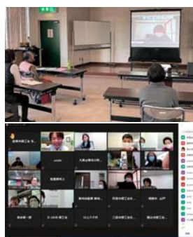
▲受講者の当日の様子

前回の幹部講習会で行ったZoom操作研修会から、さらにステップアップし、各自の都合に合った方法により受講し、多くの部員が笑顔で受講している姿がオンライン上からでも確認できた。