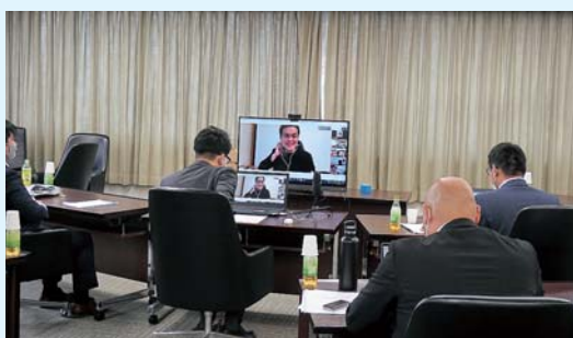
▲オンライン講習会の様子。講師・参加者ともにリモートでの参加を実現した。

の活用方法等について実際の事例も交えて紹介され、今後の兵庫県内でのG Suite推進に大いに有益な講習会となった。