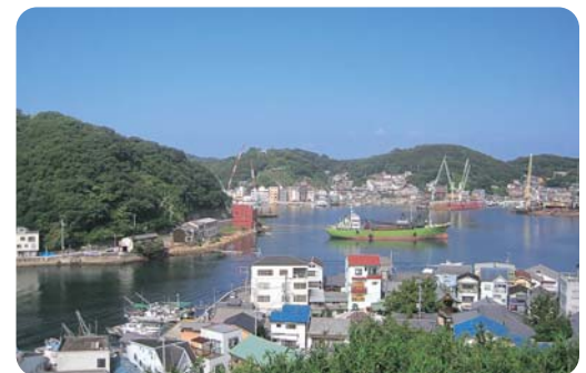
▲海運・漁業等が産業の中心であり、姫路港からの定期運航フェリーにより30分でアクセス可能。（家島町）

商工会議所地区の姫路駅周辺は、駅の再開発により大型商業施設が導入されましたが、商工会地区は自然に溢れる名所が多くあります。