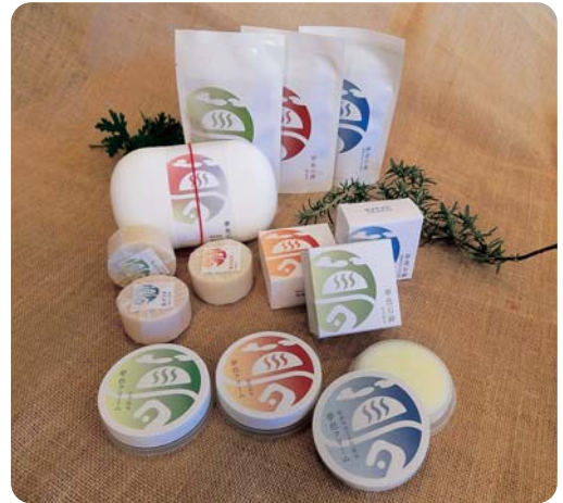
▲特産品開発品の塩田温泉郷「夢色シリーズ」