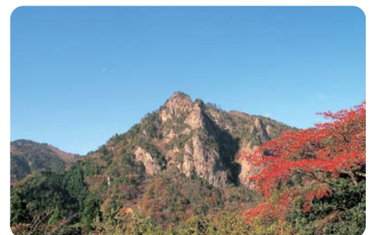
▲ロッククライミングの名所として知られている雪彦山。（夢前町）