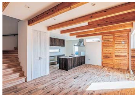
▲無垢材ならではの自然のあたたかみを感じられるダイニング。

社ブランドイメージとしてPRを開始した。特に、建材については経年による色艶の変化を楽しめるほか、冬にはだしで歩いても冷たく感じない等のメリットがある無垢材を勧めている。