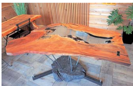
▲天然木、樹脂をテーブル部分に、石材を土台に用いたオリジナル家具“Wood River table”

「住宅と家具のどちらかが自社を知ってもらおう入口となり、住空間をトータルプロデューサーで活躍できるようにしたい」とまだまだ挑戦は続く。