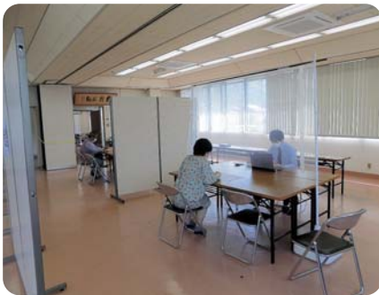
▲飛沫防止対策をして個別相談窓口で対応する職員の様子

なお、現在は、新型コロナウイルスの影響で多くの会員事業所から経営相談、金融相談があり、姫路市商工会では、国、県、市の支援事業などに係る相談窓口を設置し、各支所も常時開館して対応にあたっております。今後の見通しも未だ不透明ではありますが、引き続き会員事業所に寄り添った支援を行い、地域の中核的存在としての役割を担っていく所存です。