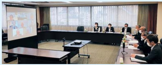
▲県連合会でWeb会議に接続している様子

5月19日、兵庫県商工会館で開催され、今後開催される理事会、総会の議題について協議した。