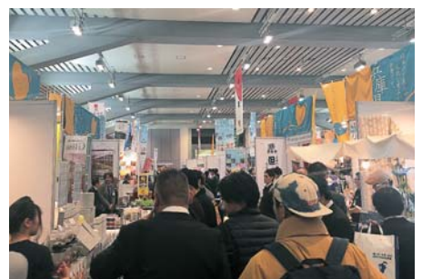
▲多くの来場者によって賑わいを見せる兵庫県ブース

経済産業省は、本支援を実施することで中小・小規模事業者における消費喚起を後押しするとともに、事業者・消費者双方におけるキャッシュレス化を推進することとしている。