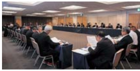
▲参加者から様々な意見が寄せられた

事務局連絡会議では各課から情報提供がなされ、意見交換の場では職員の資質向上や平成31年度新たに認定されるチーフコーディネーターの役割をはじめ、今後の運営等についての要望があった。