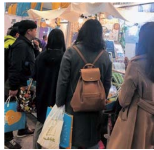
▲来場者向け手提げ袋を手に会場を巡る来場者