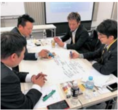
▲中小企業診断士を意図的に積極的に 交換する青年部 員たち ▲中小企業診断士を意図的に積極的に交換する青年部員たち

「あなたが目指すのは潰さない 経営？それとも拡大する経営？」 をテーマに、ワールドカフェ形 式でグループディスカッションを 行ったところ、共通の意見とし て「人材活用」が挙げられ、確 保や育成、体制等の課題につい て、活発に意見交換がなされた。 アンケートでは全員が「大変 満足」「満足」と回答しており、「新 たな気付きを得た」「ざっくりばら んに経営の話が出来て良かった」 と前向きなコメントが多かった。