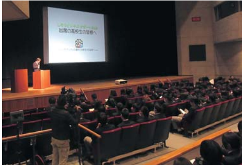
▲企業プレゼンを熱心に聞く高校生たち

本事業は、宍粟市内と近隣の企業が参加し、それぞれの企業が持つ技術やサービス・製品を展示し、異業種間の交流で、新たな製品・サービス等の開発を目的としている。宍粟市役所・宍粟市商工会・西兵庫信用金庫の三者包括連携協定に基づき、実行委員会を組織して開催した。