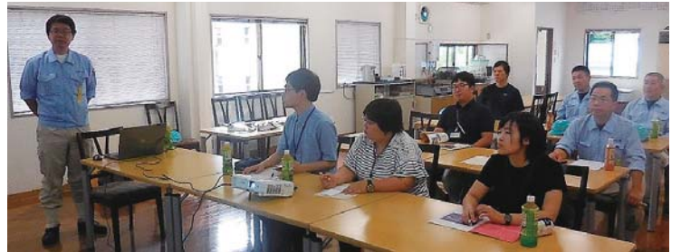
▲熱心に会社説明を受ける学生たち

市内出身の学生はもとより、市外からも参加者があり「初めての経験で何も分からない中、丁寧に指導してもらい楽しく学ぶことが出来た」「就職活動時の大きな参考としたい」等の意見があった。また、参加事業所からは