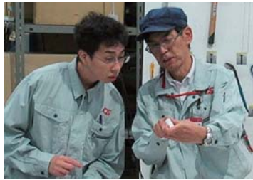
▲実地研修は学生にとって大きな学びとなった

バスツアーは、9月10日（月）・18日（火）の2日間、六粟市内の複数企業での工場見学や会社説明を受け、質疑応答や意見交換を行った。インターンシップは、9月11日（火）から14日（金）までの4日間、市内事業所において現場で製造工程を体験する等、実地での研修が行われた。