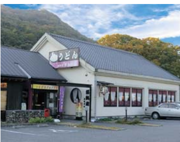
▲猪名川グルメプラザ店

第二創業でうどん屋をやるうと決めたきっかけは、かつて香川県で食べた讃岐うどんが忘れられなかったから。製麺所のすみで、100円くらいで食べた釜揚げうどんはコシがあつて、なんともいえない味わいだった。当時は讃岐うどんブームが起る前で、関西のうどんといえば柔らかいものを中心だった。うどん職人と一緒に香川県に行つて、1日7軒も食べ歩いてリサーチした結果、うどんはコシのある手打ち風、ダシは関西