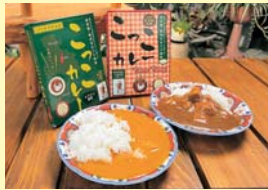
こっこカレー2種類