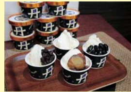
丹波三宝 丹の里アイス