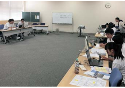
▲チームで話し合いながら取り組む太子高校生

同ゲームは、3人程度でチームを組み、社長・営業等役割を決め、オンラインでつながって