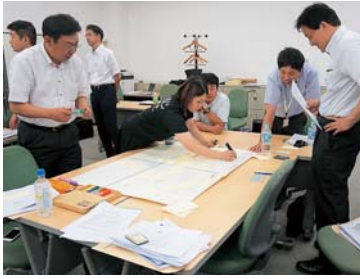
▲グループワークに取り組む受講生たち

参加者からは、「事業承継税制は大変役立つ内容であった」、「今回の研修で得たことを事業所の支援に役立てたい」などの感想があった。