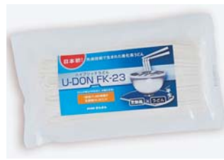
▲斬新なラベルデザインを施した贈答用の半生麺

のラベルを付けた。このネーミングやPRは、県連合会のチーフアドバイザー派遣制度を利用した。「ハイブリッドの自動車を扱っているディーラーで売ってほしい」という、洒落ったつぶりの目論見もあったようだ。