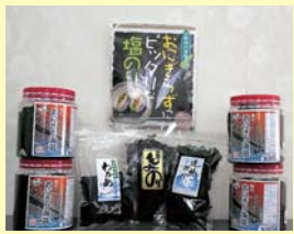
お手軽にお楽しみ頂ける「淡路島の海の恵み」セット