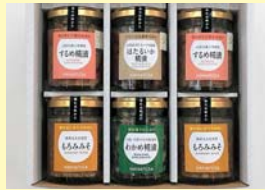
靴屋が造るごはんのお供セット