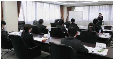
▲ビジネスマナーについて学ぶ新任職員

参加者からは、「学んだことを今後の業務に活かしていきたい」「ビジネスマナー等再確認し、基本に立ち返ることができた」などの感想があった。商工会職員として必要な基礎知識やビジネスマナーを身につけ、資質向上を図ることができた。