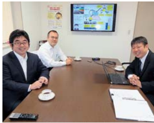
▲専門家と交えた意見交換の様子

「事業承継は本来なら5年ほど時間をかけて話を進めていくものらしいのですが、当社はタイムリミットがありましたので2年という短い期間で完了する必要がありました。そこで税理士・金融機関・商工会といった専門機関に間に入ってもらう事業承継に向けての準備を進めていきました」