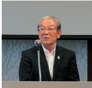
▲開会挨拶を述べる志智県連会長