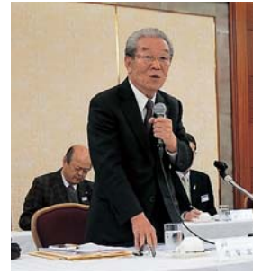
▲挨拶を述べる 志智会長