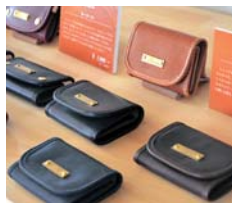
▲良質な革で作った革小物

もともと福崎町がある中播磨や西播磨地域では良質ななめし革が有名であり日本の革の約7割の生産量を誇っている。しかしそれは加工前の革の生産だけで製品作りは盛んではないのが現状であった。