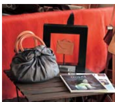
▲革見本市「ミペル・ザ・バッグショー」で入賞した商品

「日本から出品するので伝統的なものを使った作品にしようという話になり、私は『ふろしき』を使ったバッグのデザインを考案し作成しました。姫路でも腕の良いタンナー(鞣し加工業者)から布のように薄い革を提供してもらい、それをふろしきの伝統的な結び方で鞆に仕立てました」結果、高い評価を得られ、見事入賞を果たした。