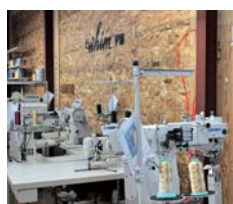
▲ものづくり補助金を活用して購入したミシン

「自社の商品を自社のブランドで販売したいですね。折角買っていただけならば安い、大量生産のものではなく、お客様が喜んで長く使っていただけのもので作っていききたいです」