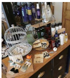
▲若い女性に人気の商品も多数販売している

将来的にはさらに都市部に店舗を出店し、店の基盤を作ってから信用の置ける従業員に任せたいと考えているという。これからの夢の実現に向けて邁進していく。