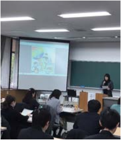
▲税制の改正内容について説明を聞く受講生

午前の研修では、時事トピックスとして、12月に決定した平成29年度税制改正の内容から、個人所得課税改革として「配偶者控除・配偶者特別控除の見直し」、企業向けに「所得税拡大促進税制の拡充（減税）」等について研修を行った。午後からの研修では、税務調査対策のポイントを学んだ。研修参加者からは、「最新の改正内容について学ぶ事ができて参考になった」等の感想が述べられた。