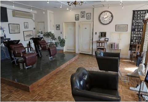
▲居心地の良い空間を演出している店内