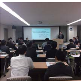
▲兵庫県中小企業診断士協会の研修の様子

その後、井戸知事をはじめ県幹部と行政懇談会を開催し、知事が日頃の兵庫県政への支援・協力に対し厚く謝辞を述べられた後、県幹部と役員との情報交換を行った。