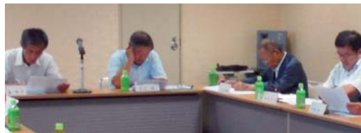
▲内容について審議する委員

また、情報漏えいの最も多い原因である人的ミスを防ぐ情報漏えい対策システム（SKYSEA）を全商工会での利用に向けたネットワーク回線について報告を行った。