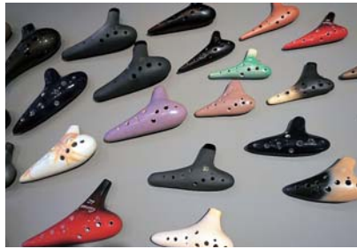
▲豊富な種類のオカリナを扱う

「扱いは始めた時期が良かったですね。ちょうどオカリナブームになる前に先陣を切って販売できたことが大きかったです。誰もやったことがないことをやることは勇気がいりますが、その