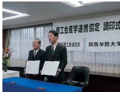
▲協定書を掲げる志智会長、関西学院大学の長峯副学長

ビジネスプランの策定、経営課題の解決策を提案してもらうなど、マーケティング分野からのアプローチを予定している。