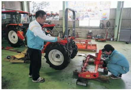
▲従業員とのコミュニケーションを大切にしている

株式会社ヤナギハラは、昭和7年に創業、平成20年から第二創業として農機具の販売・修理・買取を行ってきた。平成26年頃からネットショップで農機具の小物商品の販売を新たに開始。しかしながら、広告費を投入するものの、思ったような売上の伸びにはつながらず苦慮していた。