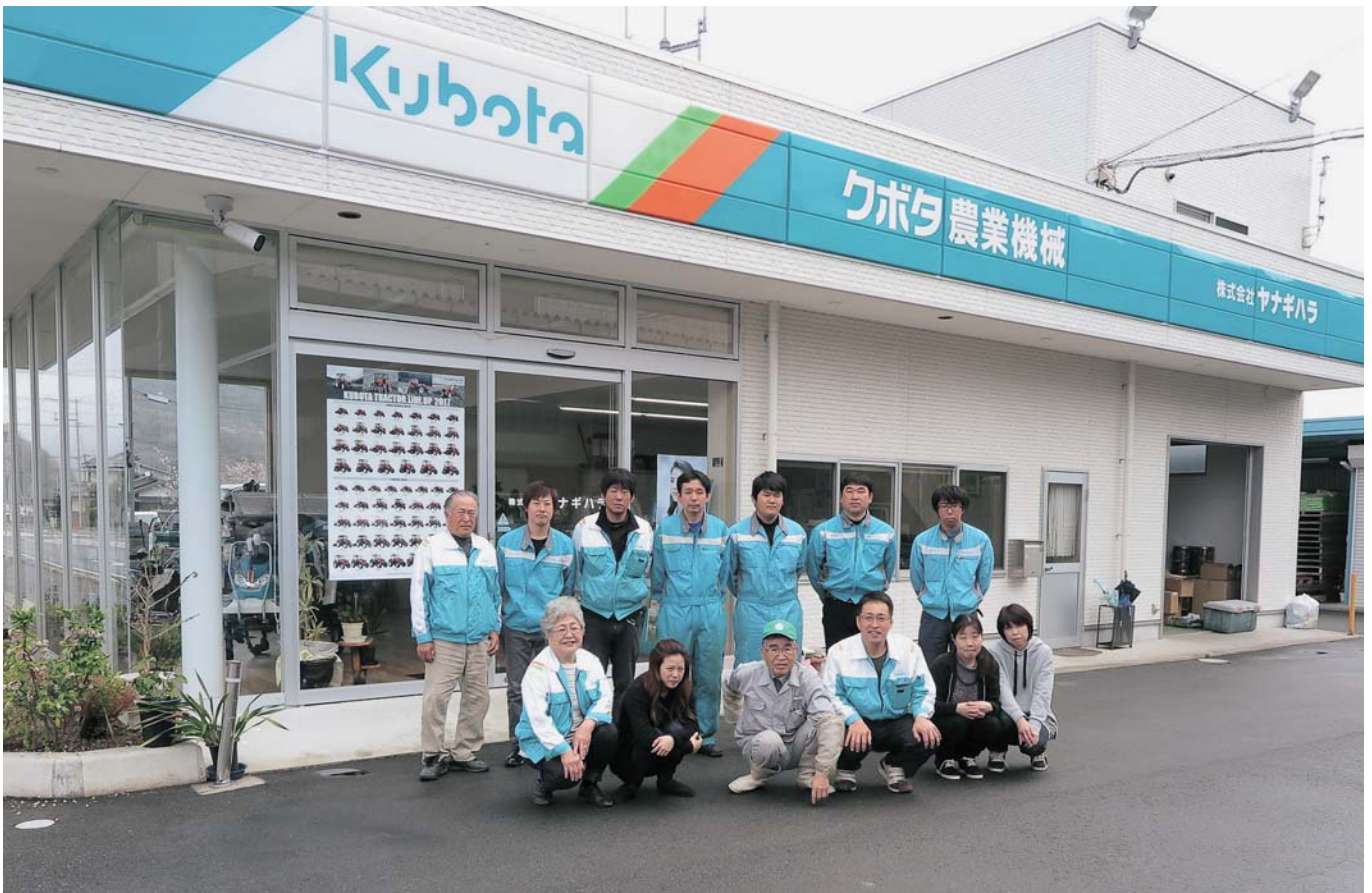
▲株式会社ヤナギハラの従業員の皆様