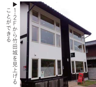
▶1・2Fから竹田城を見上げることができる

同商工会は、多くの関係者と連携・調整をはかりながら熱意と創意工夫を持って一段一段を踏みしめながら実現しているところである。