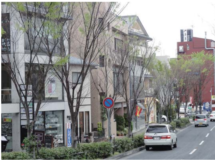
▲店舗周辺の閑静な街並み

「本物のイタリア料理を少しでもたくさんの方に味わって頂きたい」というのがオーナーシェフとしての願いである。そのため、イタリア料理にそれほど興味がない比較的若い方でも手が届く価格設定とすることで、本格的な料理との出会いの場を提供する。