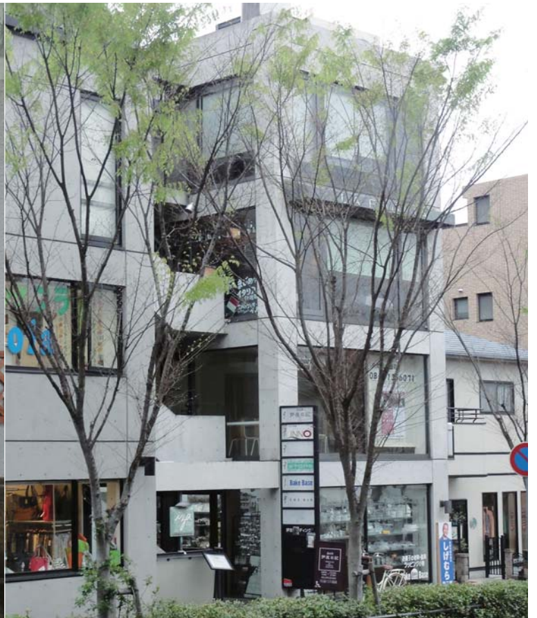
▲閑静な芦屋の街並みにたたずむ本格的イタリア料理への玄関口スパッツィオ・イノ