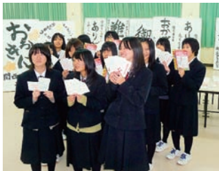
▲県立八鹿高校書道部の皆さん

となり実施している。この感謝カードは、官製はがき大の和紙に筆で「ありがとう」「サンキュー」「おおきに」など十種類の言葉が書かれているものであり、さつき福祉会おおよ作業所の身体障害者らが和紙を書いている。