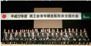
▲全国47都道府県青連会長が渋谷に集結!!

十一月二十五日「平成二十二年商工会青年部主張発表全国大会」が東京都・C.C.Lemonホールで開催され、全国より青年部員ら千六百名余りが参加、本県からは四十一名が出席した。当日は、六名の各ブロック代表による主張発表大会が行われ、それぞれの青