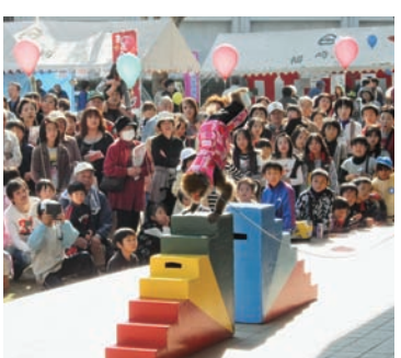
▲「ラン・ラン・ラン」によるモンキーパフォーマンス

示即売会、町内企業で製造されている工業製品の紹介コーナー、各種団体のステージイベントなどを行った。参加した方からは「毎年開催されることを心待ちにしています。」と言われ、多くの方に喜ばれている。