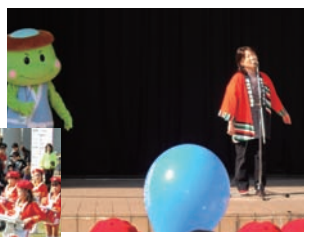
▲もちむぎ音頭披露

また、昨年度に福崎町特産品「もちむぎ」を広めるため製作した「フクちゃん」「サキちゃん」の着ぐるみと、公募より選ばれたもちむぎの歌「もちもち、むぎむぎドレミファソ」「もちむぎマーチ」「もちむぎ音頭」をみんなが歌い、保育園児はステージ上で「フクちゃん」「サキちゃん」と一緒に踊り、大いに盛り上がった。