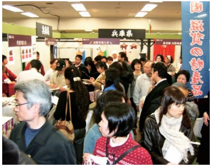
▲“出会う・ふれあう地域の魅力キャンペーン”をテーマに開催された『ニッポン全国物産展』。兵庫県ブース周辺は大盛況