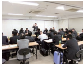
▲兵庫県内青年部の部長が意見交換

九段下にあるスター会議室において、「平成二十二年度兵庫県商工会青年部部長会」を開催。県内の青年部部長等三十九名の参加により、次の四項目について意見交換を行った。 ① 今後の役員体制について ② 経営革新推進事業について ③ 労働環境対策事業について ④ 部員増強について 参加者からは、このように県内全ての部長が集い、意見交換する場はお互いに切磋琢磨する良い機会であるとの声もあり、次年度以降継続して実施する事とした。