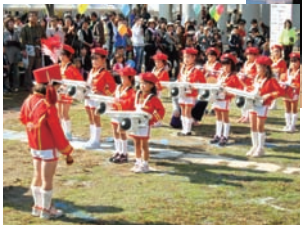
▲保育園児による鼓隊演奏