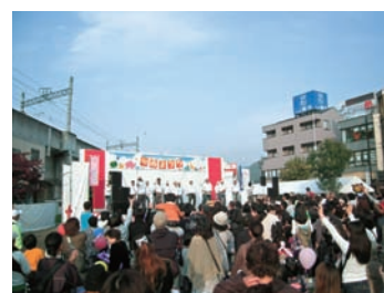
▲4万人の来場者で賑わう川西まつり