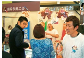
◀淡路島の特産品にお客さんも興味津津

トされたが、残念ながら入賞には至らなかった(オニオンチップスは、むらおこし特産品コンテストにおいて経済産業大臣賞受賞)。 今回の物産展では、全国四十七都道府県から地域産品の製造メーカーや農工商連携事業に取り組み地域企業、首都圏の消費者(一般並びに事業者)が多数訪れ、情報交換及び流通関係者からの引き合い等により、兵庫県の産品を広くアピールできたことと、何よりも消費者の生の声を直に聞くことができる良い機会・交流の場となった。