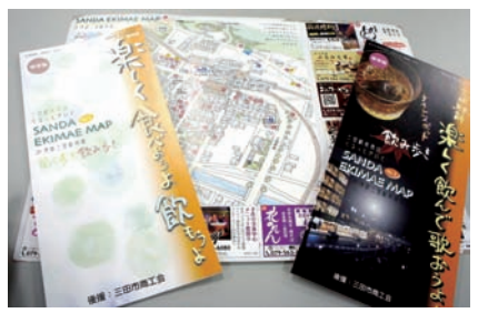
▲第2弾のナイトスポット食べ歩き飲み歩き版

二〇一〇年夏に発行され、三田市街地周辺の居酒屋などの情報をとりまとめた「三田駅前マップ・食べ歩き飲み歩き」R・神鉄三田駅前版」が好評であり、この度、第二弾となる「三田駅前マップ・ナイトスポット食べ歩き飲み歩き」R・神鉄三田駅前周辺版」が発行された。