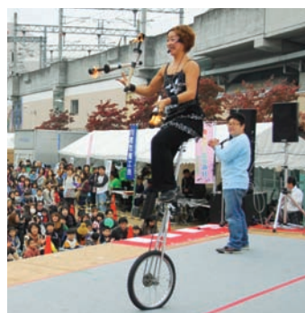
▲地元で活躍の大道芸人

当日は、建設部会によるショベルカーの体験乗車、工業部会と宝塚大学がコラボした皮革製品の展示販売。また、市民によるフリーマーケット、趣向を凝らした模擬店など、長蛇の列ができた。特に特設ステージでは『天装戦隊ゴセイジャーショー』に子どもたちが歓声を上げ、『トイレの神様』で大ブレイクした川西市出身の歌手、植村花菜の