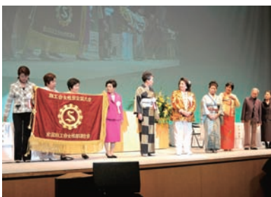
▲大会旗の引きつぎが華やかに行われる