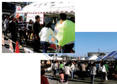
▲農業産業祭の様子と、上は恒例のみかん大安売り

この事業は、地域の活性化と地元産業の育成及び振興を目的として開催されたもので、地元香寺の特産品のみならず、商工会合併により、夢前の卵せんべ