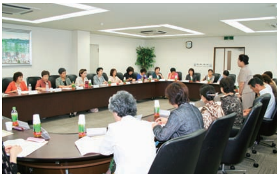
▲活発な意見交換が行われた。

本会議は、次年度以降、定期的に実施する予定。また、次回会議は、県外交流研修（十一月二十五日～二十六日）の行程中に開催する。