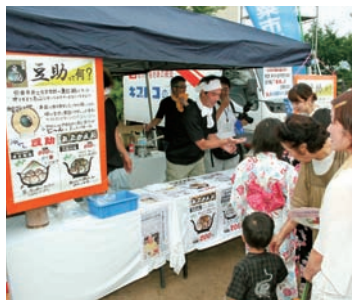
▲大人気の“冷やし豆助”

小麦粉と黒豆パウダーをたっぷり使用し、中には地元産の黒豆が一つ丸ごと入っており、こんがり真ん丸に焼きあげ、仕上げは和風だしという逸品である。かき氷でひんやり、冷やし豆助」と、とろりあんかけが絶品の、あったか豆助の二種類を考案。