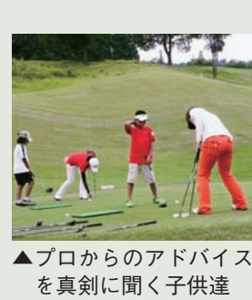
▲プロからのアドバイス を真剣に聞く子供達

七月十八日の初日は、ゴルフクラブの製造工程パネルや町内の観光施設等を紹介する催した。