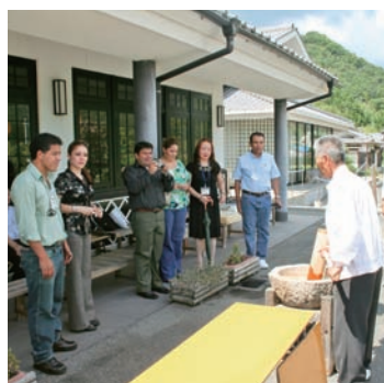
▲中米3カ国から来日した研修生

中米地域の主要産業は農業で、このような官民連携に興味を抱いたのか、研修生から多くの質問や意見が出され、視察する側、受け入れる側の双方にとって非常に有意義な研修となった。