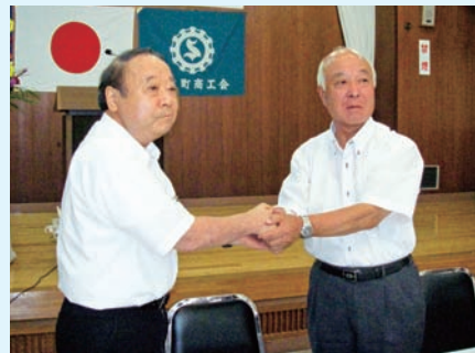
▲新商工会誕生に向けかたい握手

の会員数は合わせて約六百人。現在の浜坂町商工会館を本所とし、温泉町商工会館に支所を置く。