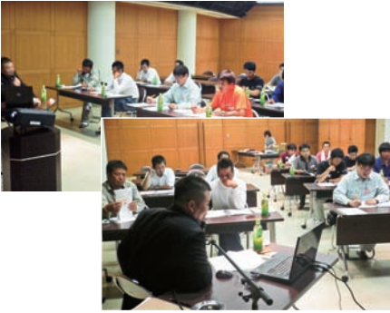
▲自分を分析し真剣に勉強

参加者のほとんどが自社を分析した事がなく、色々な事に気付かされ真剣に勉強した。年度内にテーマを変え五回程度開催予定である。