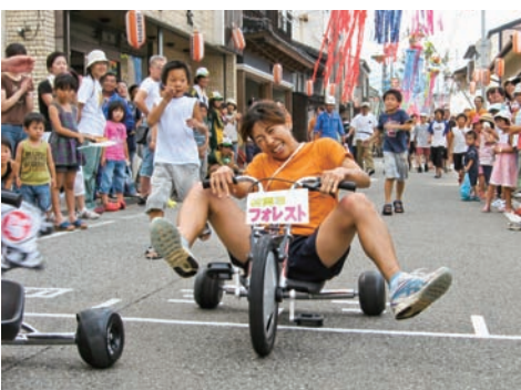
▲三輪車に跨がり悪戦苦闘