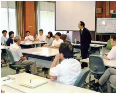
▲ロールプレイングで指導面接の技法を身につける

自分自身の課題や癖を把握し、部下の能力や意欲に合わせた指導を行っていくというもので、組織の大きさに関わらず応用のきく内容だった。何度もグループを替えて意見を交換し、動きのある実習を行なった