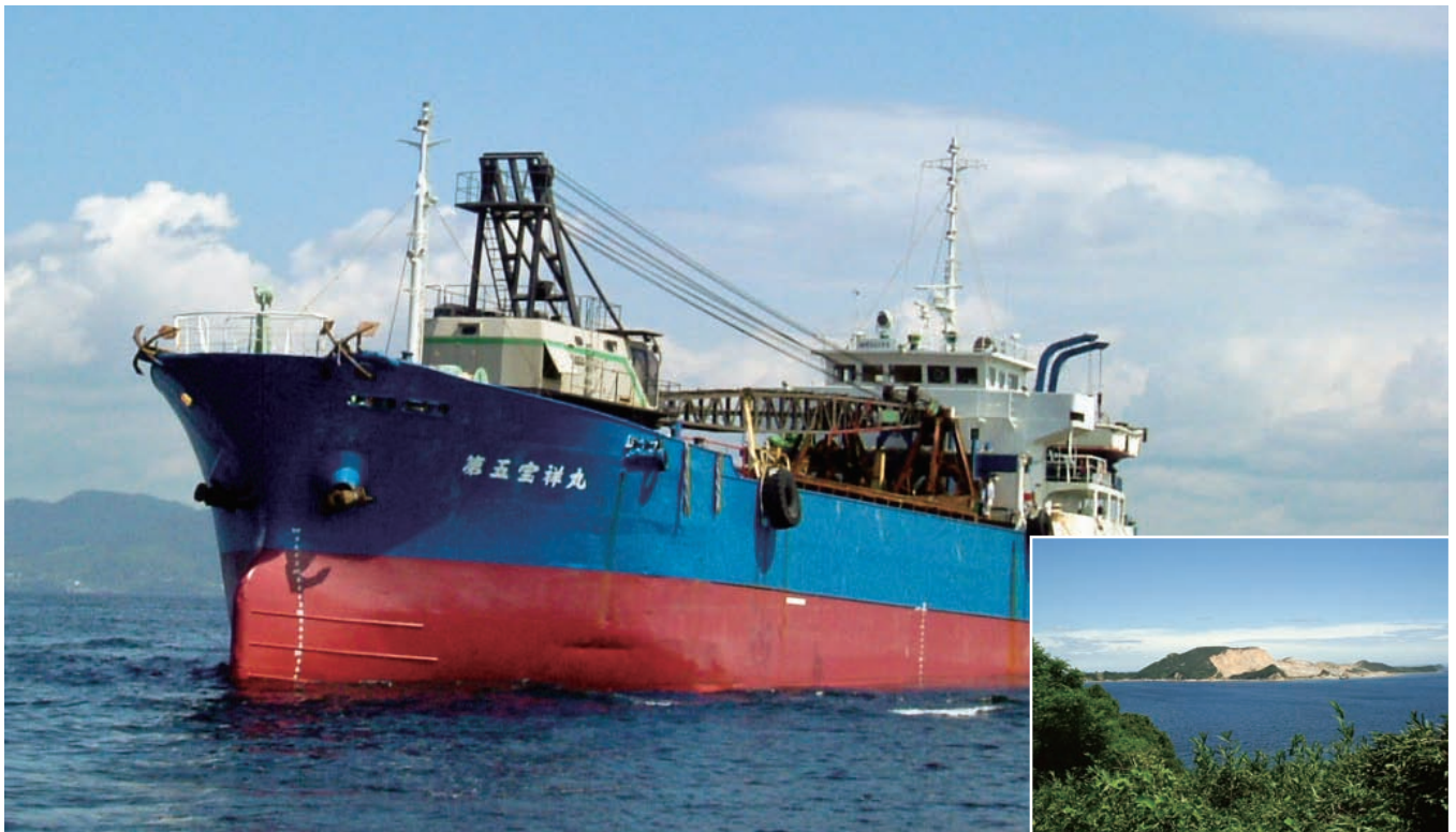
▲宝祥海運建設(株)が所有するガット船(右は家島諸島の一つ、男鹿島)