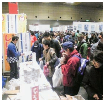
▲しし肉はるさめを求める行列

になると長蛇の列ができ、調理が間に合わない程であった。 今後、アンケートを集計し、今年の秋の販売に向け、町の名物特産品を目指し、消費者のニーズに合うよう、改善を続けていく。