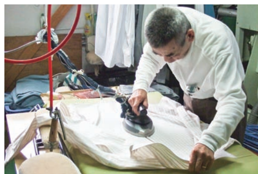
▲作業風景—あざやかな手つきで仕上げを行う。