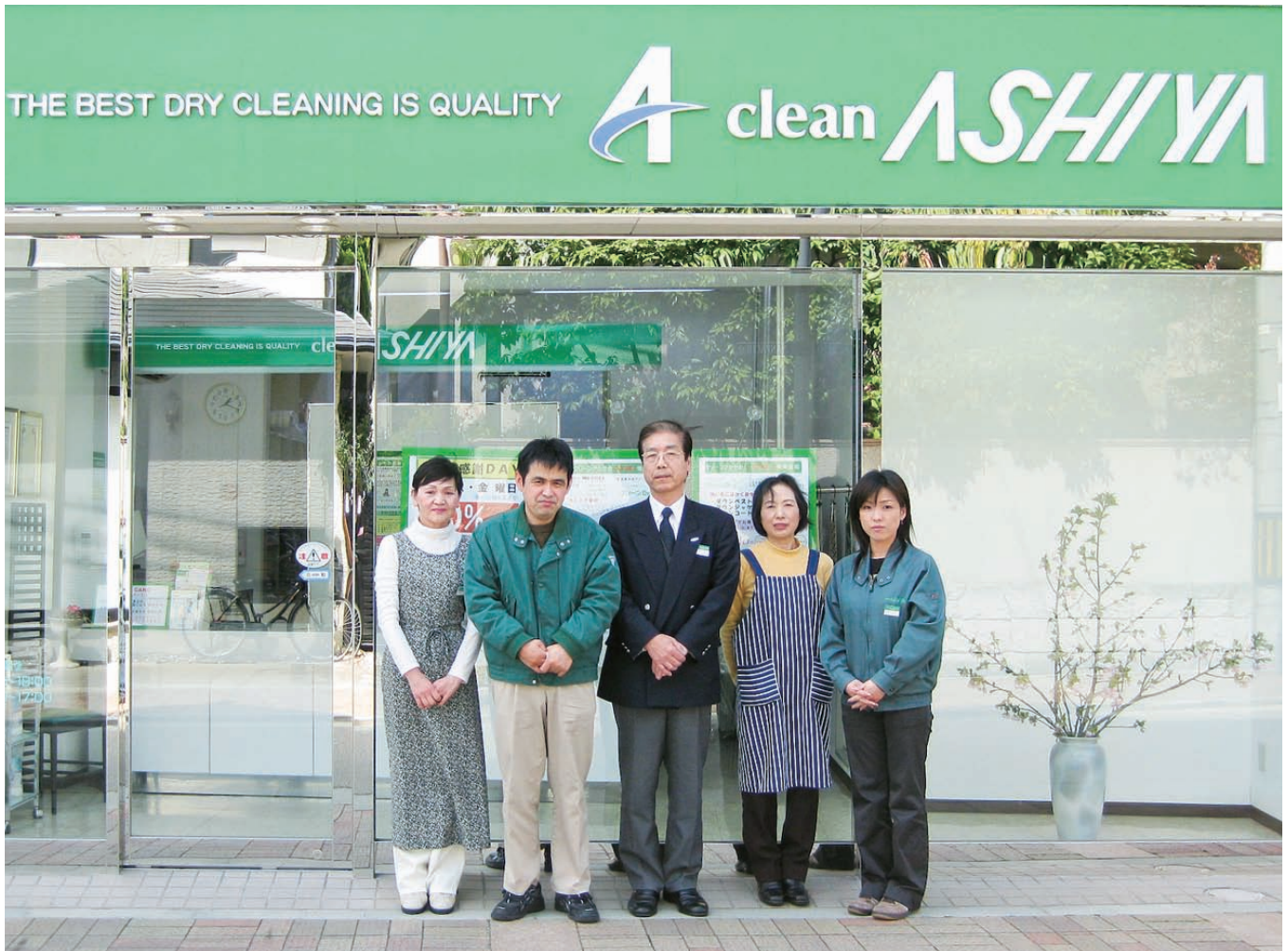
▲石田社長（写真中央）と従業員のみなさん

Hyogo Prefectural Federation of Societies of Commerce and Industry