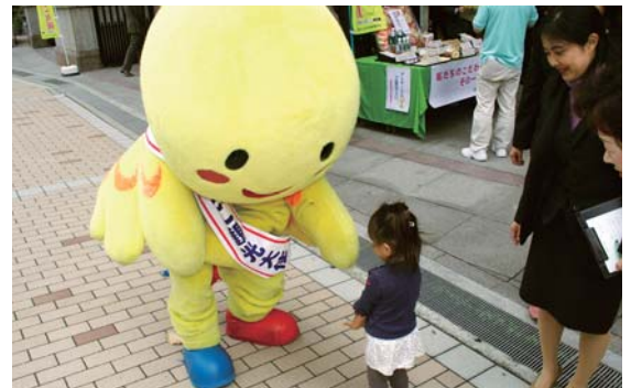
▲はばたんも応援にかけつけました。

本事業の立ち上げとして、十二月二十二日に神戸市において開催されたPRキャンペーンでは、広く一般の方々に、県下各ブロックの女性部より推薦のあった十四品を展示・紹介を行った。試食コーナーのほか、地域観光・特産品に係るアンケートも実施され、新たな商品開発につながるべく消費者の声が集められた。