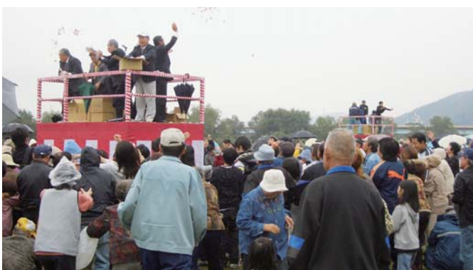
▲目玉企画「餅ほり」に観客も大喜び

そして、今回の目玉企画の「餅ほり」は、雨にもかかわらず大勢の人が集まった。フィナーレのお楽しみ「大福引大会」では、豪華賞品が用意され、発表のたびに会場は大歓声に包まれた。