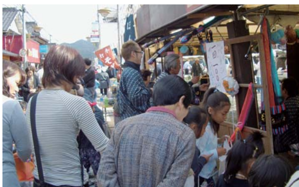
▲露店を行きかう人々

当日は、飛脚姿に扮した宿場町飛脚りレー、関西大学活動報告会、丹波布などの伝統工芸品展示、青垣の歴史探訪などの催しが行われ、さわやかな秋晴れの中、多数の来場者を迎え盛大に開催された。