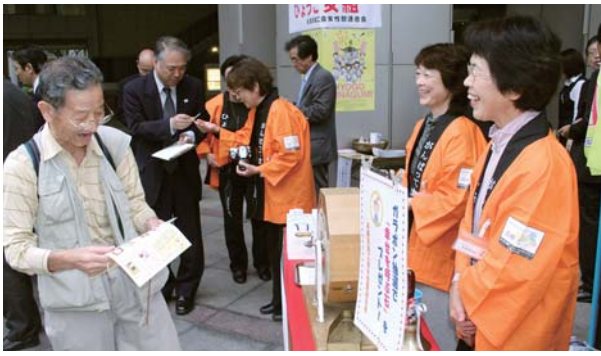
▲にぎわうPRイベント

そこで、県女性連では、「がんばってます。ひょうご女組」を立ちあげ、県下商工会女性部員の協力を集め、広域的にこの地域資源を掘り起こし、県内外に広く情報を発信する。これにより、新たな販路開拓・販売促進や観光振興を図り、地域商工業の活性化に繋げていく。