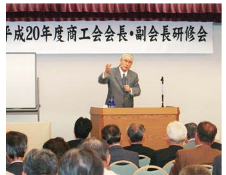
▲森田氏の鋭い切り口による経済評論