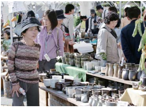
▲それぞれの窯元自慢の逸品が並ぶ

会場では、丹波焼の各種企画展示をはじめ、丹波焼の窯元約四十軒が一堂に会してテント販売を行う「陶器市」や、丹波黒豆をはじめとする丹波篠山の新鮮野菜の販売、特産物を使った飲食コーナーなど、芸術と食の