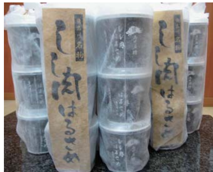
▲赤みそ仕立てでコクのある味

会場内に並ぶ町内会員事業所ブースや住民によるフリーマーケットブースも、多くの人で溢れかえっていた。