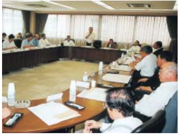
産業構造改革推進会議の開催など 14項目の報告もなされる