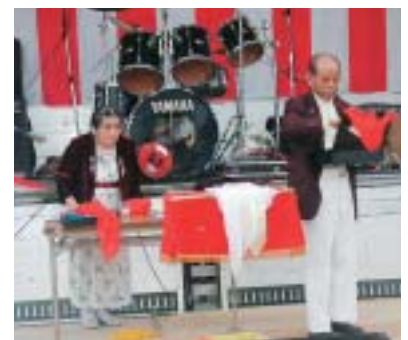
ほほえましいマジックショー