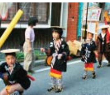
村岡藩山名子ども大名行列

村岡町の村岡商店街で八月二日、村岡町商工会（今後敏一会長）は、村岡ふる里祭りを開催し、多くの人で賑わった。 当日は、約二百名の商店街も歩行者天国になり、村岡藩山名子ども大名行列など多彩なイベントが繰り広げられた。