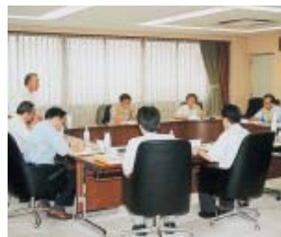
次回開催は8月4日を予定

その他、諸規程に定めのない債権管理対応を「管理回収マニュアル」として、新たに制定することとなった。