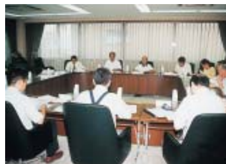
職員による政策事業提案の集計結果も報告

職員による政策事業提案については、昨年を上回る二百五十三件（当日集計時点）の提案があり、特に提案内容については