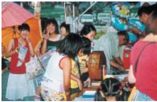
総額10万円の金券の抽選会