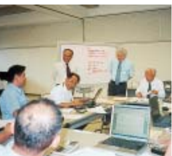
課題に熱心に取り組む受講生

同研修会は、今年から商工会議所と協力し、双方の研修を受講できる体制となり、今回は、グループ形式、一泊二日の合宿形式で実施した。