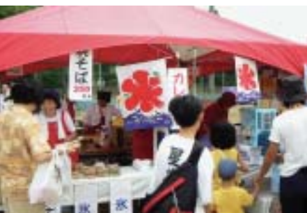
女性部の模擬店で、氷、焼きそばが売れに売れ