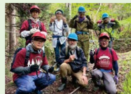
へ 安全帯を付け遺構ツアー実施