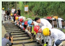
へ ボランティアによる軌道整備作業

「これからの100年に向けて」森林鉄道遺構を地域の財産として後世に残していくため、域外の方の協力も欠かせない。今回の交流を契機に、さらに多くの方に波賀森林鉄道の活動に参加していただけることが期待される。