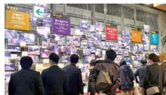
へ 人と防災未来センターでの視察研修