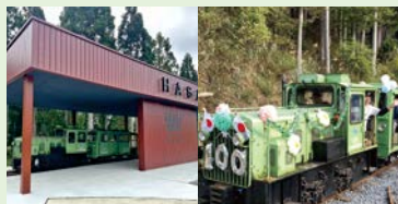
へ 完成した駅舎と機関車