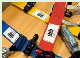
へ 森林鉄道ロゴが付された安全帯