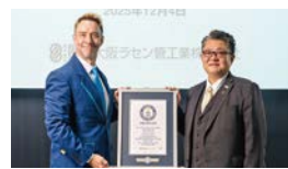
へ 超極細径フレキシブルチューブ「マイクロミニフレックス®」がギネス世界記録に認定