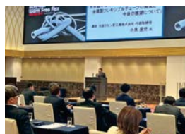
へ 様々なフレキシブルチューブの紹介

内径1.6mmを実現。大阪国際万博出展、ギネス世界記録™認定、宇宙産業への進出について講演いただいた。