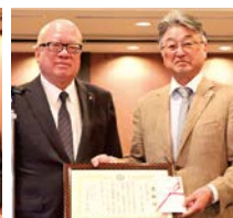
△ 上郡町商工会 大崎会長 (写真右)