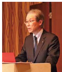
△ 全国商工会連合会 専務理事 塩田誠氏