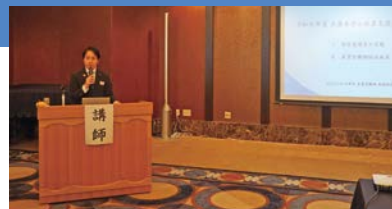
へ 兵庫県地域経済課長による講義

また、意見交換会では各商工会の事務局長より電子帳簿保存法への対応や次年度の補助金についての意見や情報が寄せられ、充足感のある内容となりました。その後、懇親会を行い、参加者相互の情報交換を行った。