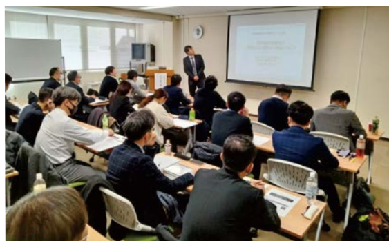
く 研 修 の 様 子

9名のCCより、令和4年度の経営支援事例の発表を実施。質問も多く出て、活発に各地域の経営支援の情報交換を行った。