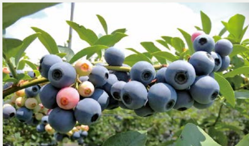
へ 6～8月が旬のブルーベリー。同園では30品種以上を栽培しており老若男女問わず楽しむことができる。

マノカルダ株式会社は、川西市黒川落合にある里山ブルーベリー農園とカフェWacca(ワッカ)を経営している。6～8月に旬を迎える無農薬栽培のブルーベリー狩りができる農園と、通年でブルーベリースィーツやランチを楽しむ併設カフェWaccaの営業を行っており、最近ではハーブや薬草、自然農法野菜の栽培にも取り組んでいる。(詳細はP4)