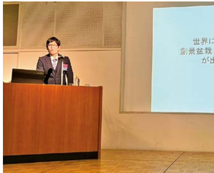
へ 小山氏による事例発表の様子