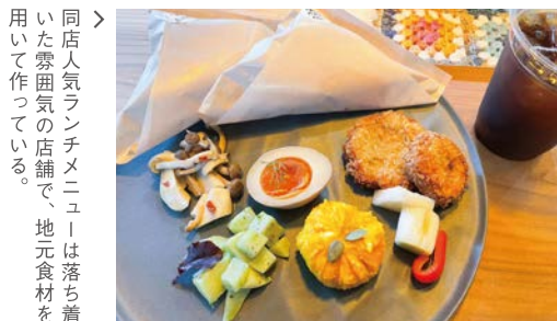
同店人気ランチメニューは落ち着いた雰囲気の店舗で、地元食材を用いて作っている。