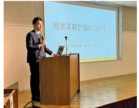
へ 太田氏による事例発表の様子