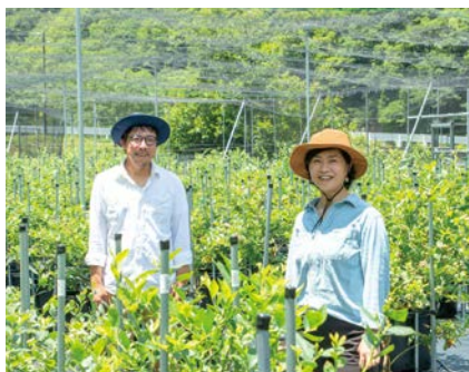
夫婦で育ててきたブルーベリー農園。食べ放題の時間は無制限なので心行くまで味わうことができる。

5月中旬から里山ブルーベリー農園 Wacca 予約受付。完全予約制であり6～8月にブルーベリー摘み取り農園を実施予定。