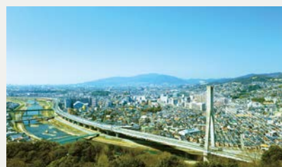
五月山からの川西市