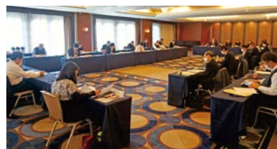
へ 事務局長による意見交換会