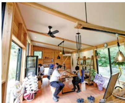
落ち着いた雰囲気です食事ができるCafe Wacca。ランチメニューの他、季節によっては当園のブルーベリーを使ったかき氷や焼き芋の販売も行っている。

その中で、少しずつ同園を盛り上げていくために、Cafe Waccaの経営を始めた他、薬草ハーブ園を作る等を行った結果、県外からの集客も増えるようになった。最近では、マスコミ取材も増え、読売テレビの「街かどトレジャー」や朝日放送の「おはよう朝日です」にも取材をされて、次第に認知度もあがってきている。