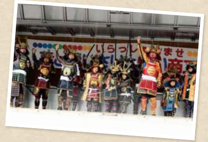
へ「手作り鎧かぶと」を身にまとった 武士たちがステージ上に並び毎年11月の恒例 行事「商工まつり」。

は町外・県外に進学し戻って来ないという状況です。そのような状況を食い止めるため、町内の雇用につながる施策として、地元の中学2年生、高校2年生を対象に町内の企業を知ってもらう企業冊子の作成と、企業が生徒に自社企業をPRするプレゼンテーションを実施しています。