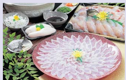
▲当店で1番人気の「淡路島3年とらふぐ松セット」。ふぐ鍋、ふぐ刺しに加え、白子も付いた淡路島3年とらふぐのフルセット。