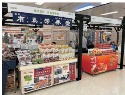
▲見やすく商品が並べられた兵庫県出展ブースの様子

新型コロナウイルス感染症対策で試飲・試食が禁止されたなか、来場者は、入場制限を行った前年度を大きく上回る約4万4千人が来場し、東京近郊に住む来場者に出展者の商品を広くPRすることができた。