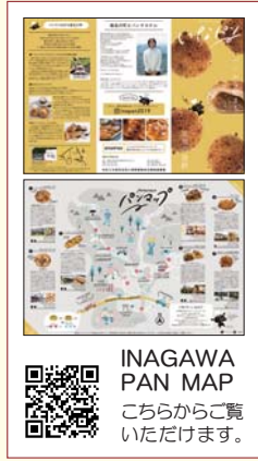
INAGAWA PAN MAP こちらからご覧ください。

活用し、第2弾、第3弾をリリース。コロナ禍でも近場を楽しむ『マイクロツーリズム』をテーマに町内外に魅力ある店舗情報を発信し、都会近くで豊かな自然が残る猪名川町の魅力も伝える企画として定着してきたところです。第3弾のパンマップは、NHKでも紹介され反響も大きく、各店の売上に貢献でき、事業の成果が得られています。