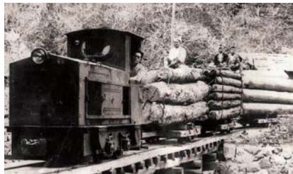
▲大正から昭和にかけて宍粟市波賀町で木材の運搬を担った波賀森林鉄道

そして11月14日、整備が済んだ森林鉄道遺構で実施したハイキングツアーの本番には、事前の広報成果もあり、申込開始即日に完売となるほど好評で、神戸方面より定員上限の18名が参加した。「次は人を誘って春に来たい」「これからも継続してツアーを実施してほしい」等、参加者から好意的な意見が多数あった。その後の商品展開は神姫観光（株）が行っており、本事業終了後も継続販売が決定している。