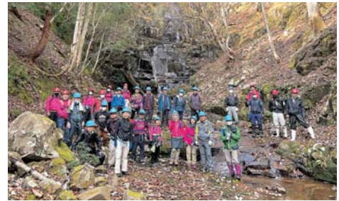
▲ハイキングツアー参加者の集合写真

同事業は、昨年度より（株）神姫バス商品開発部門担当者等と現地視察や協議を重ね、ターゲットを「50代以上の健康志向の男女」に絞り、マーケットインでの商品開発を進めてきた。ハイキングコースを整備することによる安全確保と、広報のために7月から4回の「森林鉄道整備ボランティアツアー」を実施。落石や落木の撤去等を行い、その内容を定期的にSNSで情報発信した。