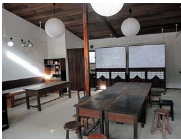
▲空き店舗を活用して作られた、「よいまちプロジェクト」のミーティングスペース

その成果として、平成28年9月、市の創業助成金が拡充された。それに加え、同市山崎町の住民により山崎中心市街地活性化委員会「よいまちプロジェクト」を発足させ(事務局・商工会)、県補助金を活用して物件改装を行い、商店街の空き家・店舗を活用してまちづくりを始める。その後3年間で新店舗が13軒