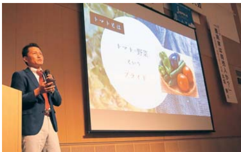
▲ひょうご商人ネットワークで最優秀賞に輝いた(株)KY田中農園(宍粟市)