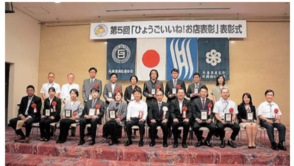
▲ひょうごいいね！お店表彰受賞者等