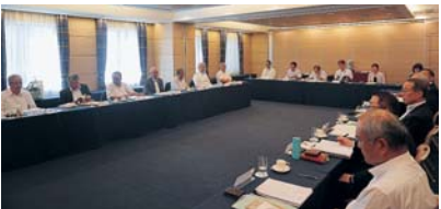
▲新任会長研修会では意見交換も行われた。

1日目の研修では、役員としての使命や県下商工会の課題について本会の役員から説明を行い、2日目は「商